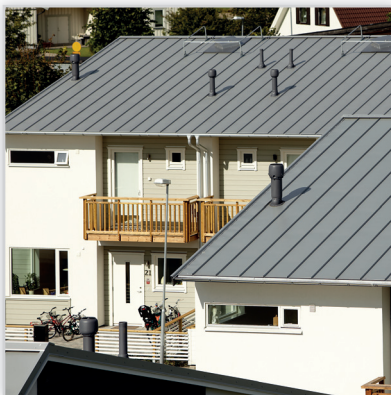
Ruukki, Classic – blacha na rąbek stojący. Zastosowanie: pokrycie dachowe. Wysokość rąbka [mm]: 32. Szerokość efektywna [mm]: 475. Szerokość całkowita [mm]: 505. Min. dł. [mm]: 800. Maks. dł. [mm]: 10 000. Wykończenie powierzchni: powłoka Pural™ mat. Kolory: ciemnoczerwony, ciemnobrązowy, czekoladowobrązowy, ceglasty, ciemnozielony, grafitowy, czarny, szary. Gwarancja: 50 lat.