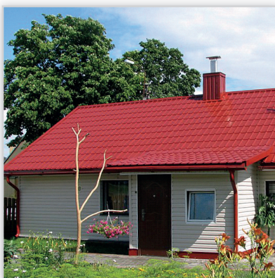
Ruukki, Decorrey – blachodachówka. Zastosowanie: pokrycie dachowe. Wysokość modułu [mm]: 28. Dł. modułu [mm]: 350 mm. Szerokość efektywna [mm]: 1130. Szerokość całkowita [mm]: 1181. Min. dł. [mm]: 850. Maks. dł. [mm]: 6800. Wykończenie powierzchni: powłoka Poliester. Kolory: grafitowy, czerwony, ciemnobrązowy, ceglasty, czekoladowobrązowy. Gwarancja: 30 lat techniczna i 10 lat estetyczna.