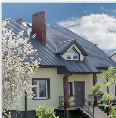
Ruukki, Profil T20 Premium – blacha trapezowa. Zastosowanie: pokrycie dachowe. Wysokość całkowita [mm]: 17. Szerokość efektywna [mm]: 1095. Szerokość całkowita [mm]: 1129. Min. dł. [mm]: 600. Maks. dł. [mm]: 12 000. Wykończenie powierzchni: powłoka Pural mat. Kolory: ciemnozielony, grafitowy, czerwony, ciemnobrązowy, czarny, ceglasty, czekoladowobrązowy, oberżyna, burgund. Gwarancja: 50 lat techniczna i 20 lat estetyczna.