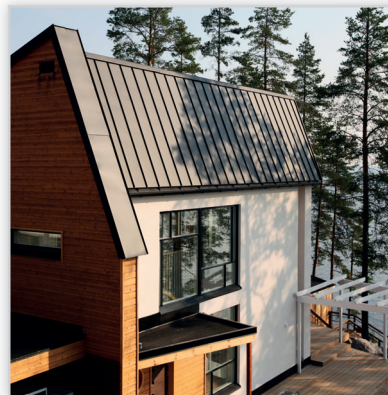
Ruukki, Classic Economy – blacha na rąbek stojący. Zastosowanie: pokrycie dachowe. Wysokość rąbka [mm]: 32. Szerokość efektywna [mm]: 475. Szerokość całkowita [mm]: 505. Min. dł. [mm]: 800. Maks. dł. [mm]: 10 000. Wykończenie powierzchni: powłoka Poliester. Kolory: grafitowy, czerwony, ciemnobrązowy, czarny. Gwarancja: 30 lat techniczna i 10 lat estetyczna.