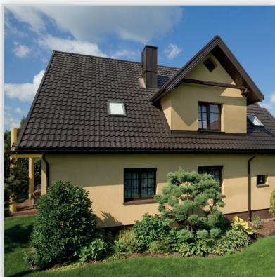
Ruukki, Finnera® – blachodachówka modułowa. Wysokość całkowita [mm]: 52. Dł. modułu [mm]: 330. Szer. efektywna [mm]: 1140. Szer. całkowita [mm]: 1190. Dł. efektywna [mm]: 660. Dł. całkowita [mm]: 705. Powierzchnia efektywna arkusza [m 2 /szt.]: 0,75. Wykończenie powierzchni: powłoka Purex™. Kolory: ciemnoczerwony, brązowy, czarny, ceglasty. Gwarancja: 40 lat. Cechy szczególne: produkt dostępny „od ręki”.