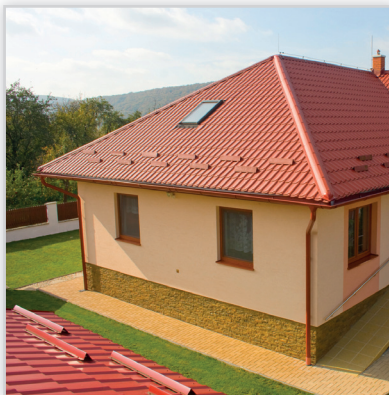
Ruukki, Monterrey Premium – blachodachówka. Zastosowanie: pokrycie dachowe. Wysokość modułu [mm]: 39. Dł. modułu [mm]: 350 mm. Szerokość efektywna [mm]: 1100. Szerokość całkowita [mm]: 1180. Min. dł. [mm]: 850. Maks. dł. [mm]: 8200. Wykończenie pow.: powłoka Pural mat. Kolory: ciemnozielony, grafitowy, czerwony, ciemnobrązowy, czarny, ceglasty, czekoladowobrązowy, oberżyna, burgund. Gwarancja: 50 lat techniczna i 20 estetyczna.