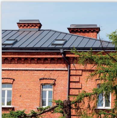
Ruukki, Classic Premium – blacha na rąbek stojący. Zastosowanie: pokrycie dachowe. Wysokość rąbka [mm]: 32. Szerokość efektywna [mm]: 475. Szerokość całkowita [mm]: 505. Min. dł. [mm]: 800. Maks. dł. [mm]: 10 000. Wykończenie powierzchni: powłoka Pural mat. Kolory: szary, grafitowy. Gwarancja: 50 lat techniczna i 20 lat estetyczna.