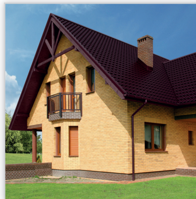
Ruukki, Adamante™ – blachodachówka. Zastosowanie: pokrycie dachowe. Wysokość modułu [mm]: 55. Dł. modułu [mm]: 350. Szerokość efektywna [mm]: 1125. Szerokość całkowita [mm]: 1153. Min. dł. [mm]: 850. Maks. dł. [mm]: 8200. Wykończenie powierzchni: powłoka Pural™ mat. Kolory: ciemnozielony, grafitowy, czerwony, ciemnobrązowy, czarny, ceglasty, oberżyna, burgund, czekoladowo-brązowy. Gwarancja: 50 lat.