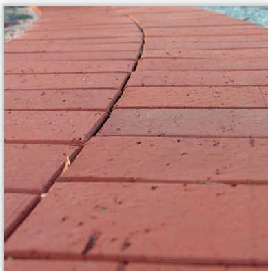
Lode Bruk klinkierowy.