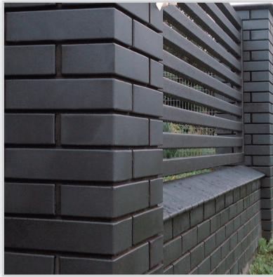
Lode Premium Cegła klinkierowa HERKULES.