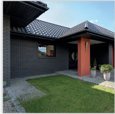
Lode Premium Cegła klinkierowa SATURN.