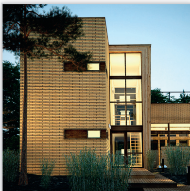
Lode Premium Cegła elewacyjna Sarmite.