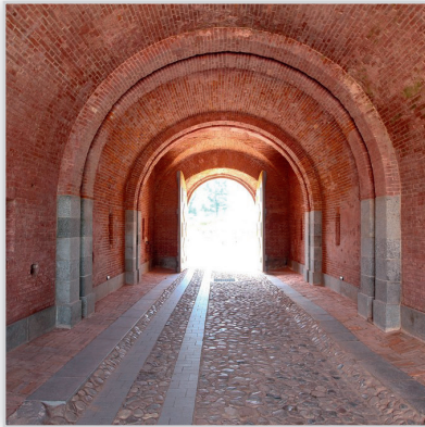
Lode Premium Cegła ręcznie formowana SENCIS.