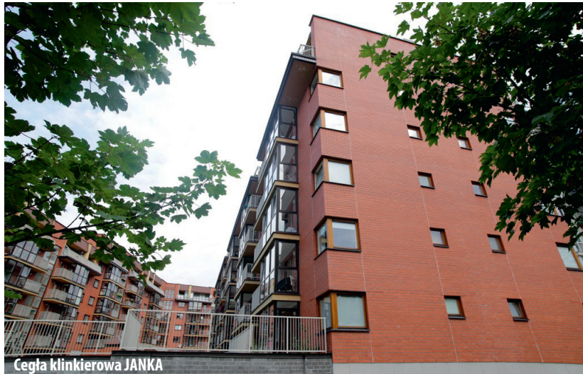
Cegła klinkierowa JANKA