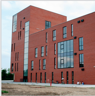
Lode Premium Cegła klinkierowa LIBRA.