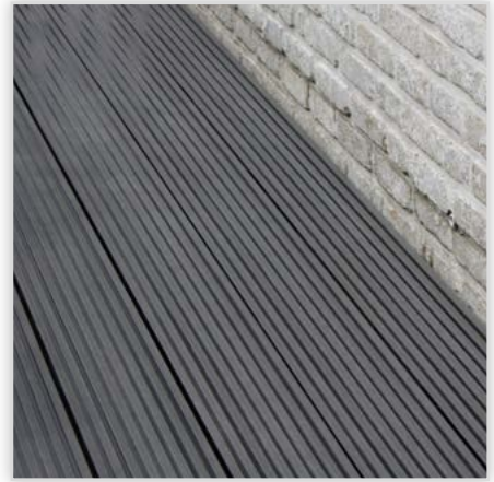
Kompozytowa deska tarasowa Duofuse dwustronnie ryflowana Na zdjęciu: kolor grafitowy. Index produktu DFD162GB-4.0