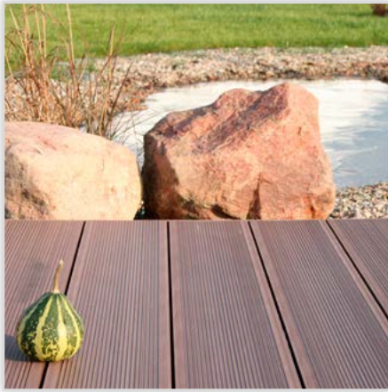
Kompozytowa deska tarasowa Duofuse dwustronnie ryflowana idealne rozwiązanie do budowy obrzeża oczka wodnego. Na zdjęciu: kolor tropikalny brąz. Index produktu DFD162TB-4.0