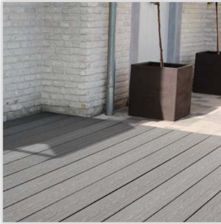
Kompozytowa deska tarasowa Duofuse o strukturze drewna podkreśla granitowe elementy ogrodu jak również aluminiową stolarkę. Na zdjęciu: kolor kamienno-szary. Index produktu DFDE162SG-4.0