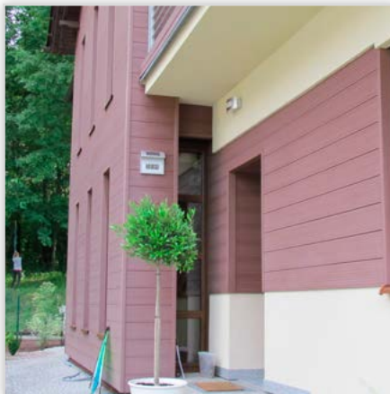
System montażu desek – specjalnie opracowany system pozwala na montaż desek Duofuse na elewacji dając efekt ciekawego połączenia różnych materiałów.