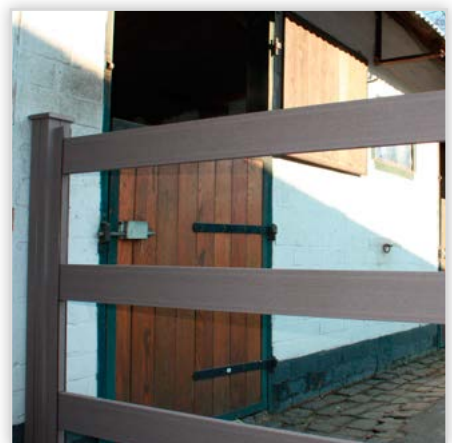
System ogrodzeń ażurowych Duofuse (farmerskich) to idealne rozwiązanie do budowy stylowych, rustykalnych płotów ogrodowych lub ogrodzeń wybiegów dla koni i innych zwierząt.