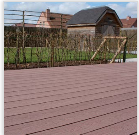
Taras kompozytowy może okazać się funkcjonalnym i estetycznym uzupełnieniem małej architektury popularnych „ogródków działkowych”.