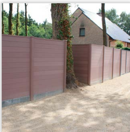
Kompozytowe ogrodzenie pełne Duofuse (łączone na pióro i wpust) – rozwiązanie to tworzy jednolity, spójny i niezwykle elegancki płot o wyglądzie drewna.