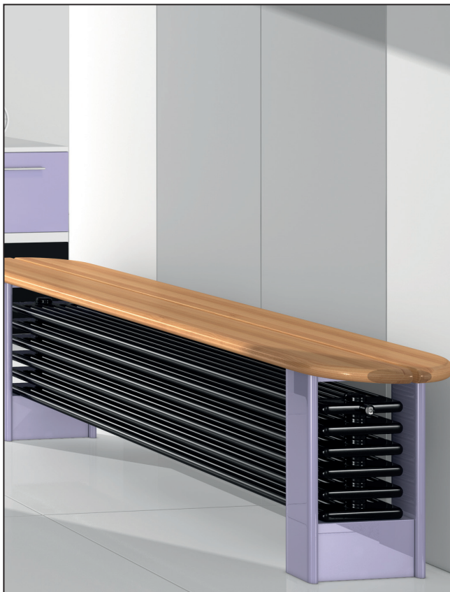
GRZEJNIK KOLUMNOWY LASERLINE BANK