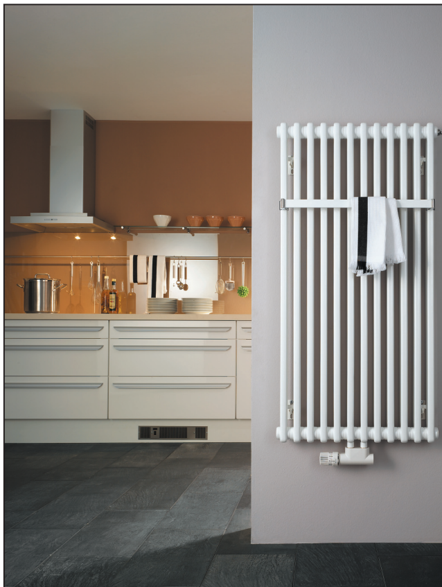
GRZEJNIK KOLUMNOWY LASERLINE TWIN