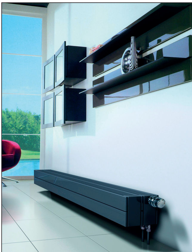
GRZEJNIK KONWEKTOROWY VONARIS