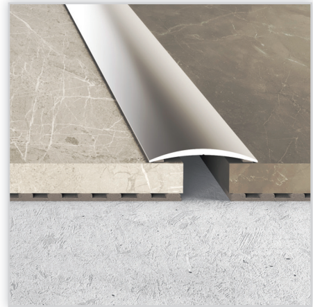
LISTWY ŁĄCZENIOWE Z ALUMINIUM Na zdjęciu: listwa łączeniowa A13