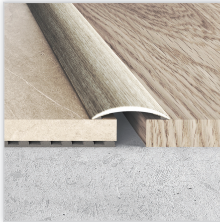
LISTWY PRZYPODŁOGOWE Z ALUMINIUM Na zdjęciu: listwa łączeniowa A03