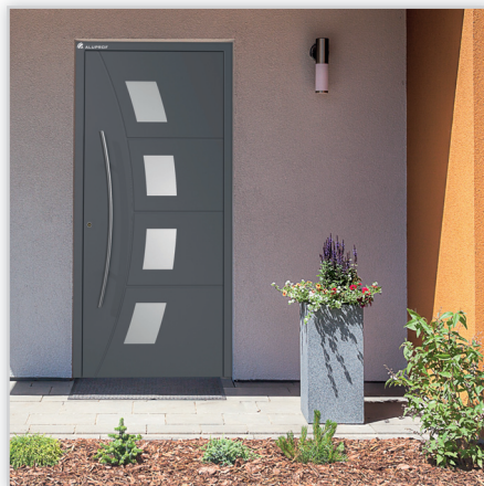
DRZWI WEJŚCIOWE PANELOWE