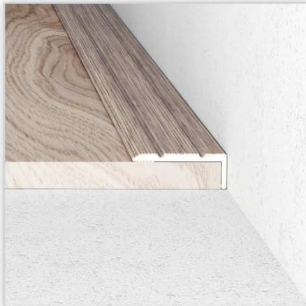
LISTWY ŁĄCZENIOWE Z ALUMINIUM Na zdjęciu: kątownik A31