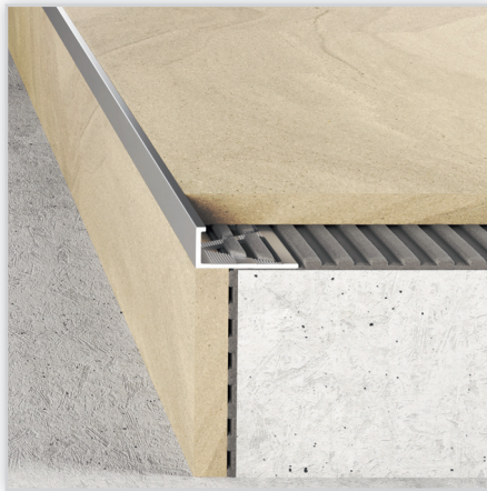
LISTWY DO GLAZURY Na zdjęciu: profil A50