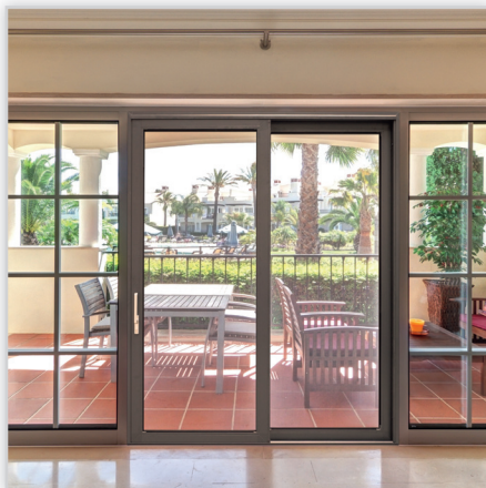
DRZWI PRZESUWNE I PODNOSZONO-PRZESUWNE