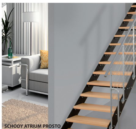
SCHODY ATRIUM PROSTO

Firma Atrium poleca nowe kolekcje: ATRIUM COLOR, ATRIUM BIANCO, ATRIUM RUSTICO i ATRIUM GRAND. Ze wszystkimi kolekcjami można się zapoznać na stronie internetowej www.atriumsystem.eu Wybrane produkty do samodzielnego montażu dostępne od ręki w sklepie internetowym.