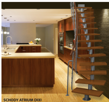
SCHODY ATRIUM DIXI