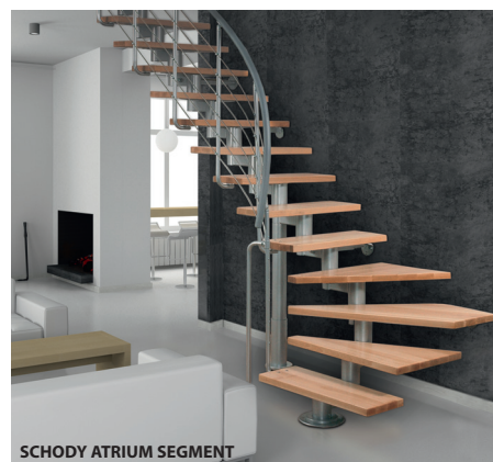
SCHODY ATRIUM SEGMENT