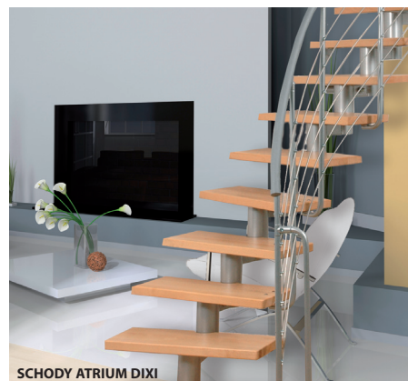
SCHODY ATRIUM DIXI