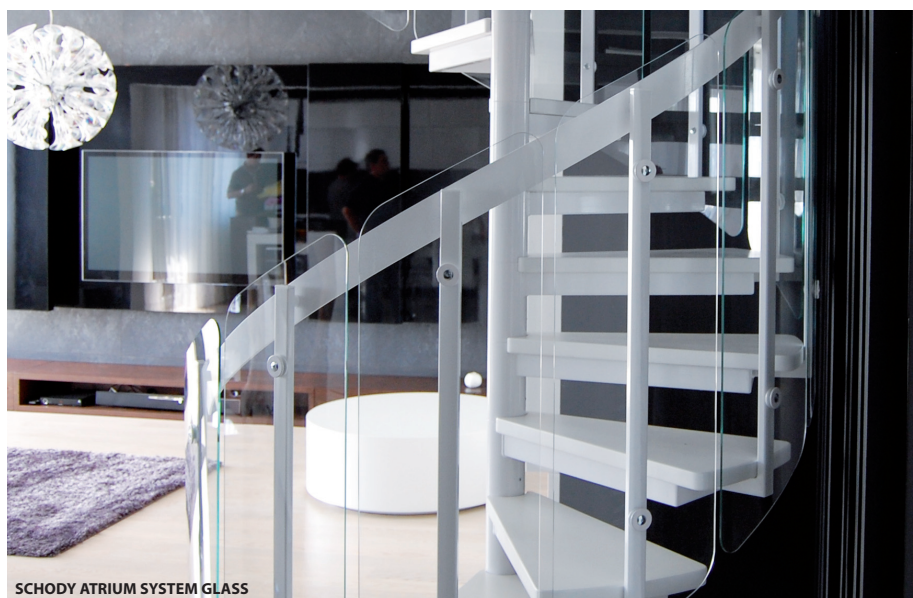
SCHODY ATRIUM SYSTEM GLASS