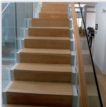
Schody na wylewce – dąb naturalny, balustrada szklana.