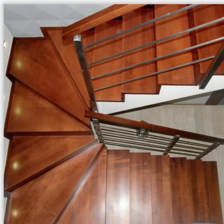
Schody na wylewce betonowej – dywanowe, drewno bukowe barwione, balustrada stal szlachetna.