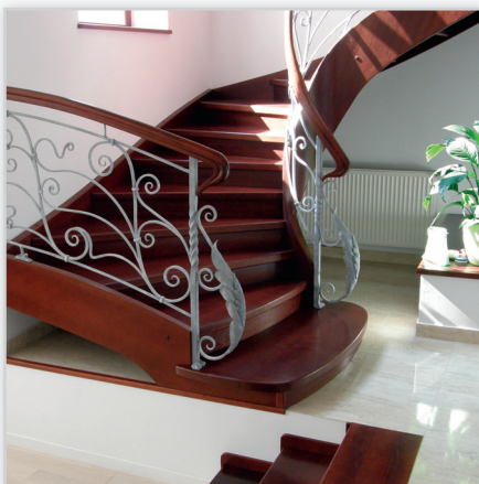
Schody częściowo gięte – drewno bukowe barwione, balustrada kuta.