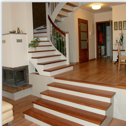
Schody samonośne – stopnie i poręcze z drewna egzotycznego bodo, reszta buk barwiony na biało, balustrada rurki stal szlachetna.