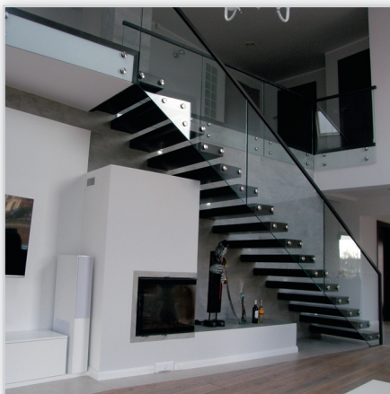
Schody półkowe ze szklaną balustradą – drewno dębowe barwione na kolor.