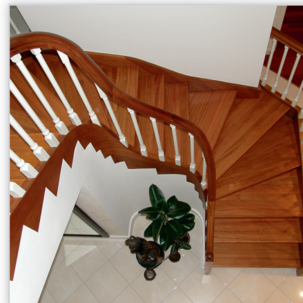
Schody na wylewce betonowej – drewno egzotyczne jatoba, tralki białe.