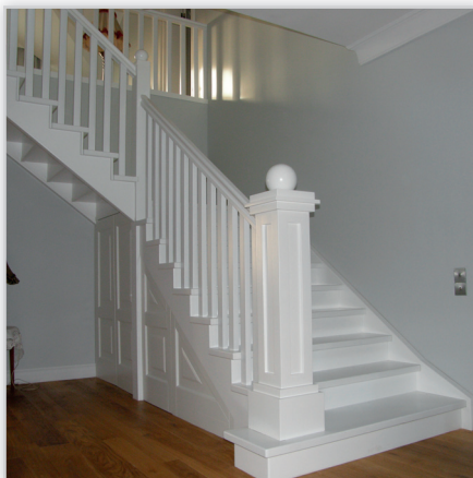
Schody samonośne z drewna bukowego całe barwione na biało.