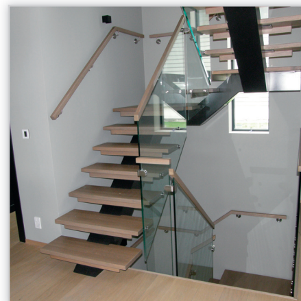
Schody na jednej belce policykowej – stopnie dąb, balustrada szklana, belka policykowa z drewna barwiona na kolor graffit.