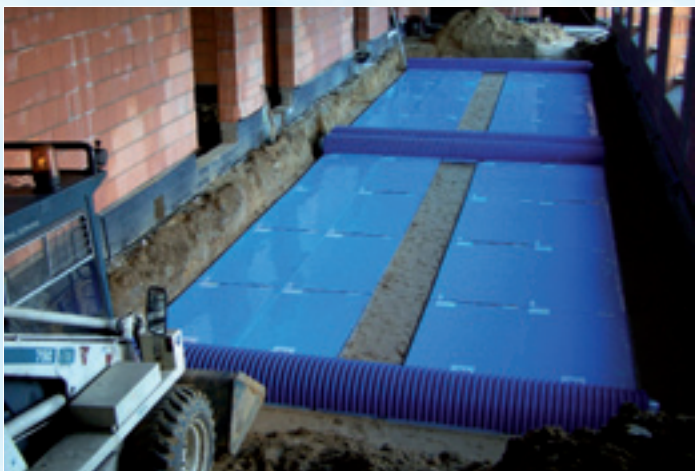
GWC PROVENT-GEO - 32 PŁYTY