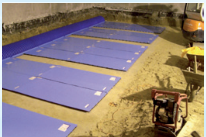
GWC PROVENT-GEO - 55 PŁYT

WIĘCEJ ZDJĘĆ Z NASZYCH REALIZACJI NA STRONACH INTERNETOWYCH