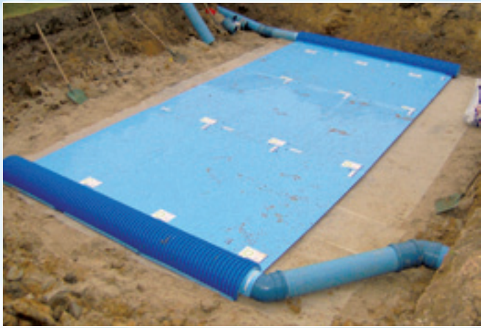
GWC PROVENT-GEO 400