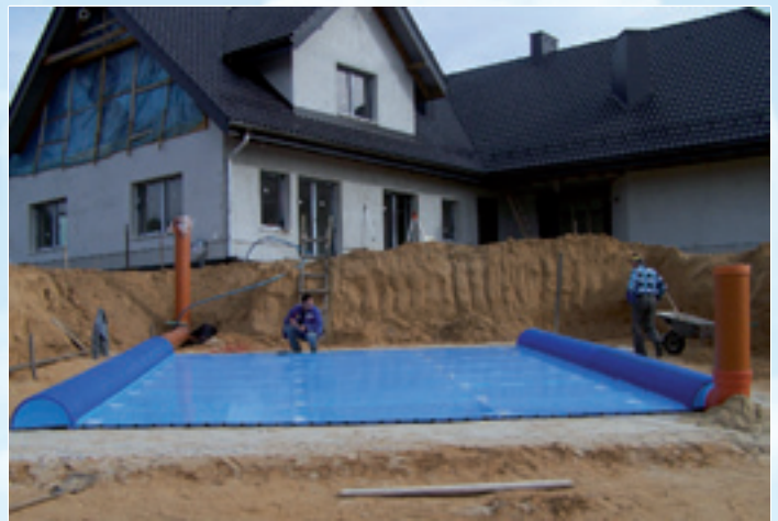
GWC PROVENT-GEO 1200