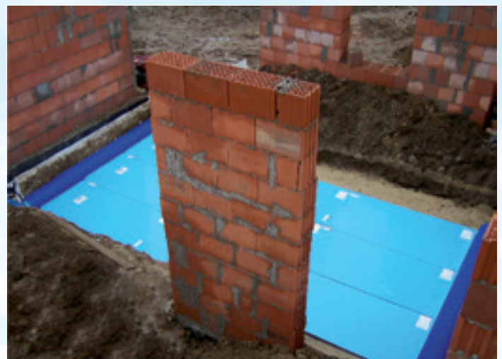
GWC PROVENT-GEO 300