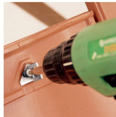
Etap 2 Przymocowanie dachówki i spinki za pomocą wkrętu