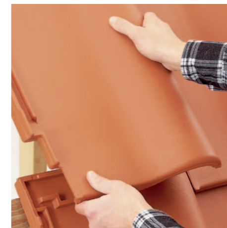
Etap 3 Ułożenie dachówek w kolejnym rzędzie