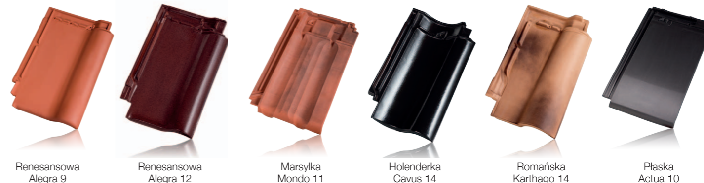
Renesansowa Alegra 9