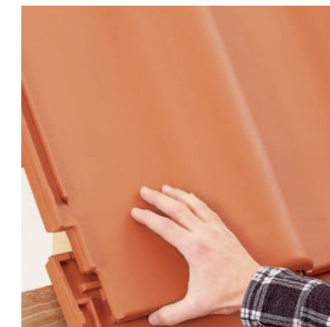
Etap 4 Dociśnięcie dachówki w celu zatrzaśnięcia spinki SturmFIX