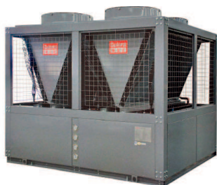
AGREGAT WODY LODOWEJ