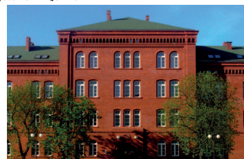
Legnica – PWSZ Im. Witelona