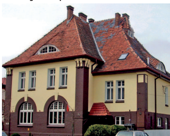
Wągrowiec – Szkoła Muzyczna