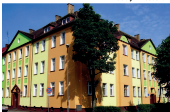
Białogard – Wspólnota Mieszkaniowa