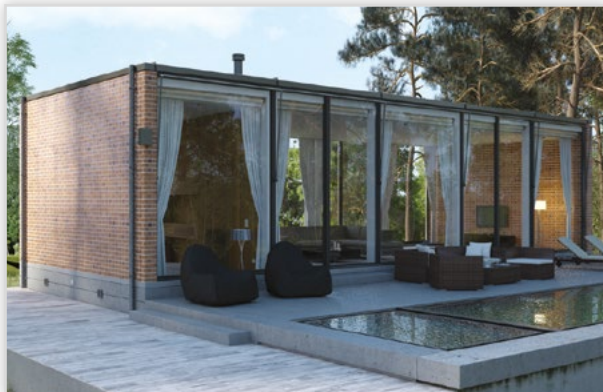
Płytki klinkierowa HF07 Old house. Zastosowanie: elewacje wszelkiego rodzaju budynków, wnętrza, ogrodzenia i mała architektura.