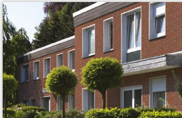
Płytki klinkierowa HF03 Brick tower. Zastosowanie: elewacje wszelkiego rodzaju budynków, wnętrza, ogrodzenia i mała architektura.