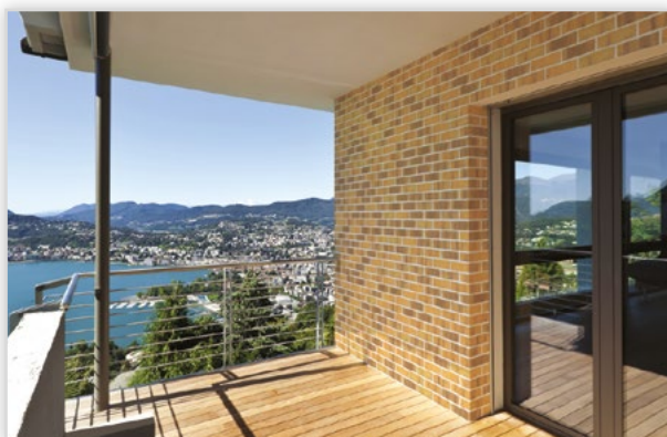
Płytki klinkierowa HF14 Sun city. Zastosowanie: elewacje wszelkiego rodzaju budynków, wnętrza, ogrodzenia i mała architektura.