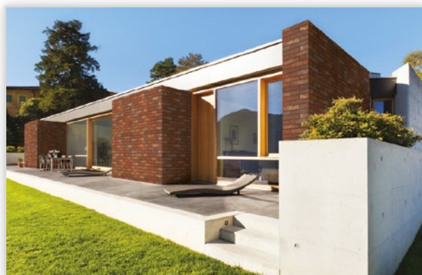
Płytki klinkierowa HF16 Bastille wall. Zastosowanie: elewacje wszelkiego rodzaju budynków, wnętrza, ogrodzenia i mała architektura.