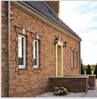
Vendersanden, Cegły i płytki ręcznie formowane – 3 Neo Magnolia. Zastosowanie: elewacje wszelkiego rodzaju budynków, elementy dekoracyjne we wnętrzach, ogrodzenia i mała architektura.