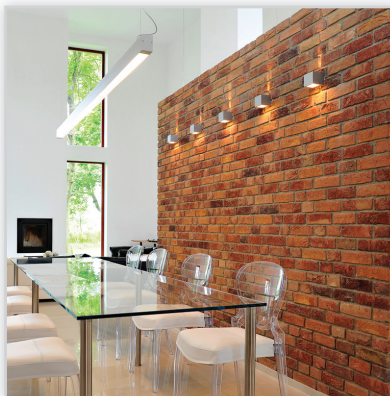
Vendersanden, Cegły i płytki ręcznie formowane – 29 Primula. Zastosowanie: elewacje wszelkiego rodzaju budynków, elementy dekoracyjne we wnętrzach, ogrodzenia i mała architektura.