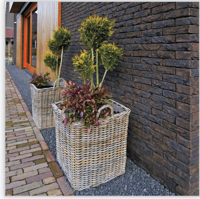
Vendersanden, Cegły i płytki ręcznie formowane format ZERO - 97 Robusta. Zastosowanie: elewacje wszelkiego rodzaju budynków, elementy dekoracyjne we wnętrzach, ogrodzenia i mała architektura.