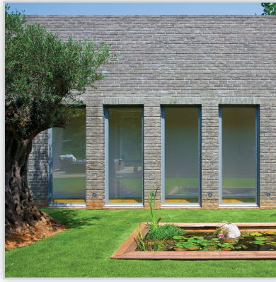
Vendersanden, Cegły i płytki ręcznie formowane – 4 Platina. Zastosowanie: elewacje wszelkiego rodzaju budynków, elementy dekoracyjne we wnętrzach, ogrodzenia i mała architektura.