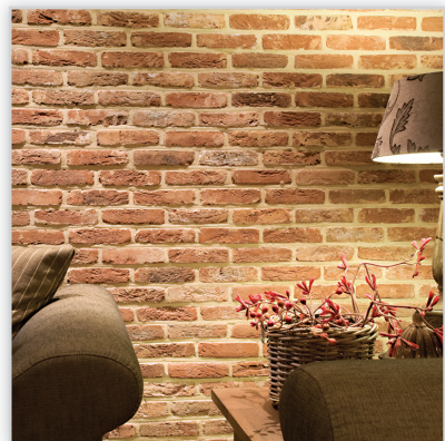
Vendersanden, Cegły i płytki ręcznie formowane – 60 Oud Brabant. Zastosowanie: elewacje wszelkiego rodzaju budynków, elementy dekoracyjne we wnętrzach, ogrodzenia i mała architektura.