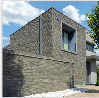
Vendersanden, Cegły i płytki ręcznie formowane – 45 Lithium. Zastosowanie: elewacje wszelkiego rodzaju budynków, elementy dekoracyjne we wnętrzach, ogrodzenia i mała architektura.