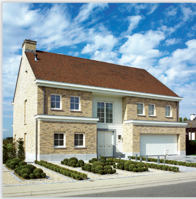
Vendersanden, Cegły i płytki ręcznie formowane – 64 Corum. Zastosowanie: elewacje wszelkiego rodzaju budynków, elementy dekoracyjne we wnętrzach, ogrodzenia i mała architektura.