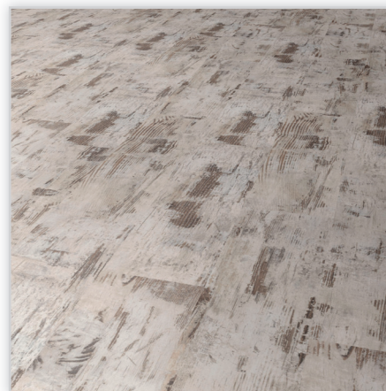
Kolekcja Piazza Maxi, dekor Dąb portugalski. Symbol: EI430PM. Wymiary [mm]: 1380/243/10. Wzór: pełna deska, powierzchnia: matowa. Cechy: płyta nośna Aqua Protect, warstwa antystatyczna, warstwa wzmacniająca DPL+ , nadaje się do czyszczenia maszynowego, klasa ścieralności ACS , montaż bezklejowy LocTec.