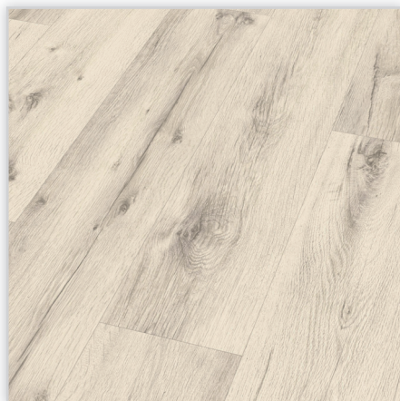
Kolekcja Marena XLV4, dekor Dąb Tennessee biały. Symbol: EI102MXLV4. Wymiary [mm]: 1845/243/10; rzadko spotykana długa deska . Wzór: pełna deska, powierzchnia: matowa (wygląd podłogi olejowanej), 4-stronna V-fuga. Cechy: płyta nośna Aqua Protect, warstwa antystatyczna, klasa ścieralności AC4, montaż bezklejowy LocTec.