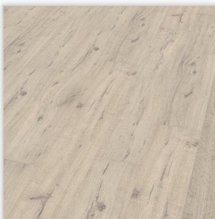
Kolekcja Marena Live, dekor Dąb solny. Symbol: EI751ML. Wymiary [mm]: 1288/192/8. Wzór: pełna deska; struktura jedwabisto-matowa, 4-stronna V-fuga. Cechy: płyta nośna Aqua Protect, warstwa antystatyczna, klasa ścieralności AC4, montaż bezklejowy LocTec, kolekcja limitowana.