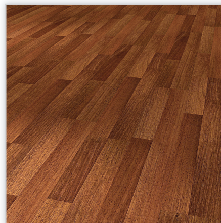
Kolekcja Piazza, dekor Afrykańska afzelia. Symbol: AF100P. Wymiary [mm]: 1288/192/8 (10 z systemem wyciszającym). Wzór: deska podwójna; powierzchnia matowa. Cechy: płyta nośna Aqua Protect, warstwa antystatyczna, warstwa wzmacniająca DPL+ , nadaje się do czyszczenia maszynowego, klasa ścieralności ACS , montaż bezklejowy LocTec, kolekcja dostępna z podklejonym systemem akustycznym Sound Protect.