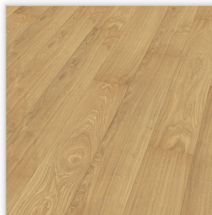
Kolekcja Marena V2, dekor Dąb szampański. Symbol: EI325MV2. Wymiary [mm]: 1380/192/8. Wzór: pełna deska; powierzchnia Synchron (wyraźne sęki i wyżłobienia) , 2-stronna V-fuga. Cechy: płyta nośna Aqua Protect, warstwa antystatyczna, klasa ścieralności AC4, montaż bezklejowy LocTec.