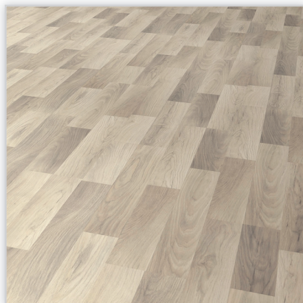
Kolekcja Marena, dekor Japoński dąb biały. Symbol: EI700M. Wymiary [mm]: 1288/192/8 (10 z systemem wyciszającym). Wzór: deska podwójna, struktura jedwabisto-matowa. Cechy: płyta nośna Aqua Protect, warstwa antystatyczna, klasa ścieralności AC4, montaż bezklejowy LocTec, kolekcja dostępna z podklejonym systemem akustycznym Sound Protect.