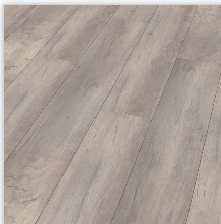
Kolekcja Marena Maxi V2, dekor Dąb solny. Symbol: EI265MMV2. Wymiary [mm]: 1380/243/8. Wzór: pełna deska; struktura: jedwabisto-matowa, 2-stronna V-fuga. Cechy: płyta nośna Aqua Protect, warstwa antystatyczna, klasa ścieralności AC4, montaż bezklejowy LocTec.