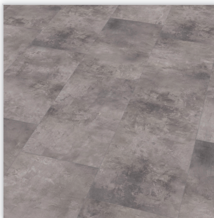
Kolekcja Marena Stone V4, dekor Concrete. Symbol: S310MSV4. Wymiary [mm]: 596/305/8. Wzór: imitacja kamienia, struktura typu Soft, 4-stronna V-fuga. Cechy: płyta nośna Aqua Protect, warstwa antystatyczna, klasa ścieralności AC4, montaż bezklejowy LocTec.