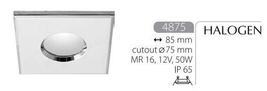
4875 HALOGEN ↳ 85 mm cutout Ø75 mm MR 16, 12V, 50W IP 65