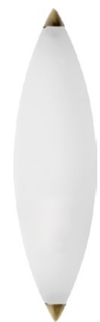
64918 STEFANY patyna ↓ 28 cm ↳ 7 cm 1 x E14 max 40W IP 21