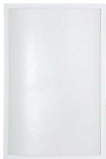
3750 GARDA I biały mat ↑ 28 cm ↔ 18,5 cm 1 x E27 max 25W IP 65