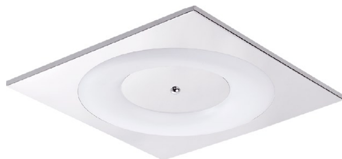
3988 NIAGARA ↔ 40,5 cm ↔ 40,5 cm 1 x T5, 55W incl. IP 43

stal chromowana, tworzywo sztuczne - electroplated steel, plastics - хромированная сталь, пластики