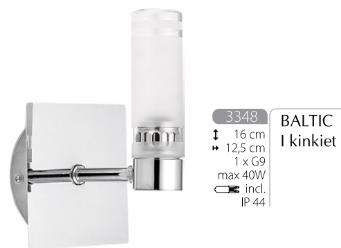
3348 BALTIC I kinkiet ↓ 16 cm ↳ 12,5 cm 1 x G9 max 40W incl. IP 44