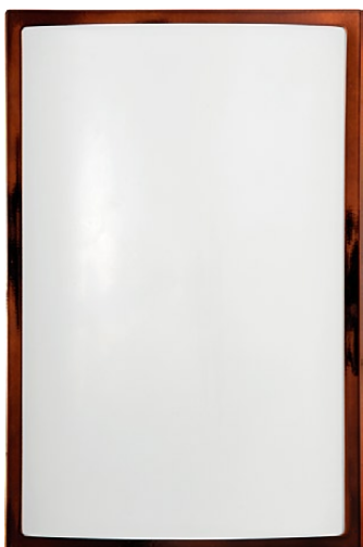
3755 GARDA I brązowy połysk ↑ 28 cm ↔ 18,5 cm 1 x E27 max 25W IP 65