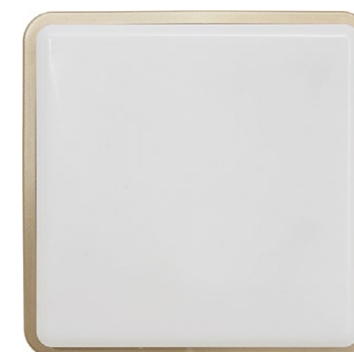
3123 TAHOE I złoty metalik ↓ 25 cm ↔ 25 cm 1 x E27, max 25W IP 65