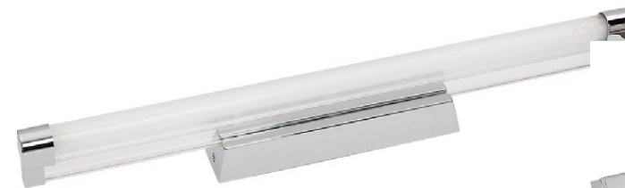
4835 OREGON M ↔ 58 cm ↔ 9,5 cm 1 x T5 incl. max 14W IP 43

stal, aluminium, tworzywo sztuczne - steel, aluminum, plastics - сталь, алюминий, пластики