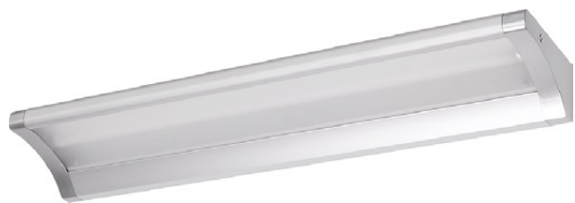
3973 YOSEMITE silver M ↔ 60 cm ↔ 7,5 cm 1 x T5, 14W incl. IP 43