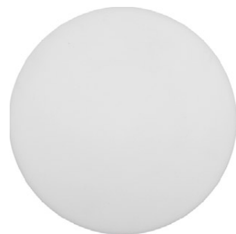
3956 LEA ∅ 25 cm ↓ 11 cm 1 x E27 max 60W IP 44

drewno, szkło → wood, glass → дерево, стекло