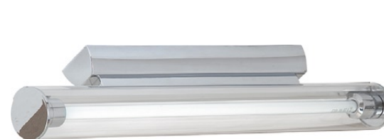
3977 MISSISIPI I chrom M ↔ 60,5 cm ↔ 11 cm 1 x T5, 14W incl. IP 43