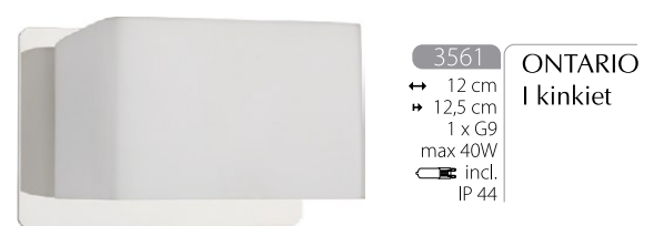
3561 ONTARIO I kinkiet ↳ 12 cm ↳ 12,5 cm 1 x G9 max 40W incl. IP 44

aluminium, szkło - aluminium, glass - алюминий, стекло