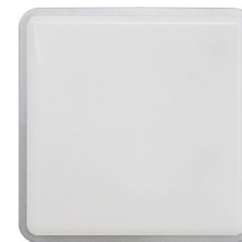
3250 TAHOE I biały mat ↓ 25 cm ↔ 25 cm 1 x E27, max 25W IP 65