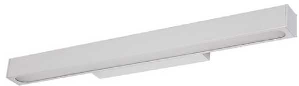
3975 COLORADO silver M ↔ 59,5 cm ↔ 7 cm 1 x T5, 14W incl. IP 43