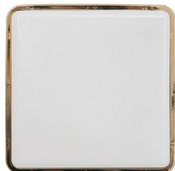
3120 TAHOE I złoty połysk ↓ 25 cm ↔ 25 cm 1 x E27, max 25W IP 65