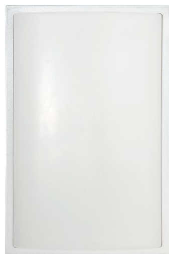
3751 GARDA I srebrny metalik ↑ 28 cm ↔ 18,5 cm 1 x E27 max 25W IP 65