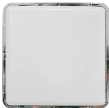
3118 TAHOE I chrom ↓ 25 cm ↔ 25 cm 1 x E27, max 25W IP 65

drewno, szkło → wood, glass → дерево, стекло