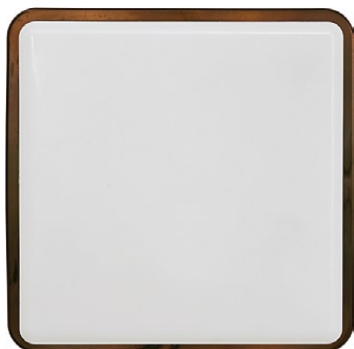
3121 TAHOE I brązowy połysk ↓ 25 cm ↔ 25 cm 1 x E27, max 25W IP 65