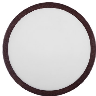
3940 LEA round wenge ∅ 30 cm ↓ 11 cm 1 x E27 max 60W IP 44