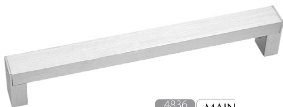
4836 MAIN S ↔ 55 cm ↔ 10 cm 1 x T5 incl. max 8W IP 43

stal, aluminium, tworzywo sztuczne - steel, aluminum, plastics - сталь, алюминий, пластики