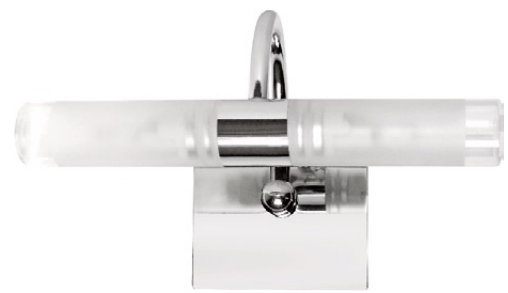
4386 BALTIC II kinkiet A ↳ 23 cm ↳ 12,5 cm 2 x G9 max 40W incl. IP 44