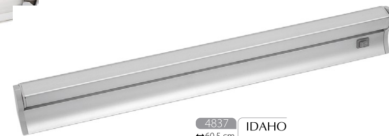
4837 IDAHO M ↔ 60,5 cm ↔ 9,5 cm 1 x T5 incl. max 14W IP 43