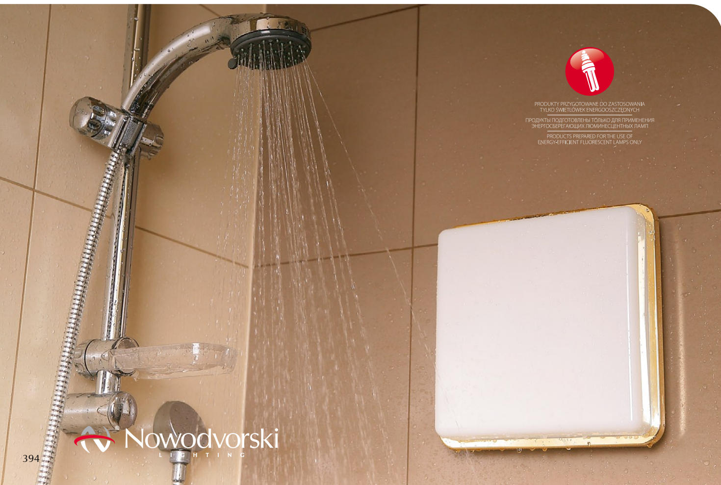
3242 TAHOE II brązowy połysk 2 x E27, max 25W