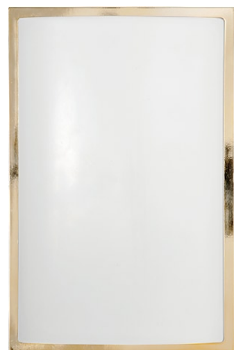
3754 GARDA I złoty połysk ↑ 28 cm ↔ 18,5 cm 1 x E27 max 25W IP 65