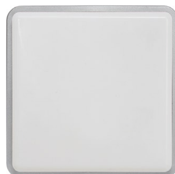
3122 TAHOE I srebrny metalik ↓ 25 cm ↔ 25 cm 1 x E27, max 25W IP 65