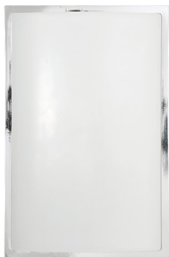
3752 GARDA I chrom ↑ 28 cm ↔ 18,5 cm 1 x E27 max 25W IP 65