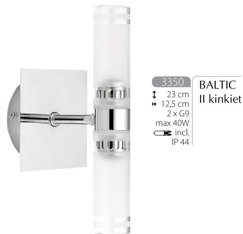
3350 BALTIC II kinkiet ↓ 23 cm ↳ 12,5 cm 2 x G9 max 40W incl. IP 44