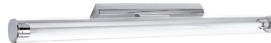
3978 MISSISIPI I chrom L ↔ 90,5 cm ↔ 11 cm 1 x T5, 21W incl. IP 43

stal, szkło, plastik - steel, glass, plastics - сталь, стекло, пластики