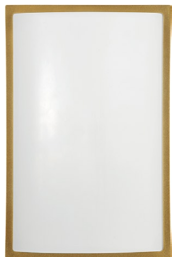
3753 GARDA I złoty metalik ↑ 28 cm ↔ 18,5 cm 1 x E27 max 25W IP 65