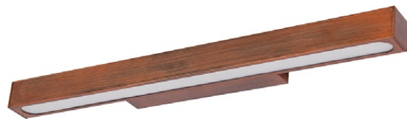
3976 COLORADO brown M ↔ 59,5 cm ↔ 7 cm 1 x T5, 14W incl. IP 43