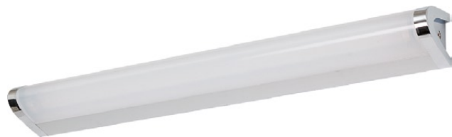
3974 MICHIGAN silver M ↔ 58 cm ↔ 11,5 cm 1 x T5, 14W incl. IP 43

stal, aluminium, tworzywo sztuczne - steel, aluminum, plastics - сталь, алюминий, пластики