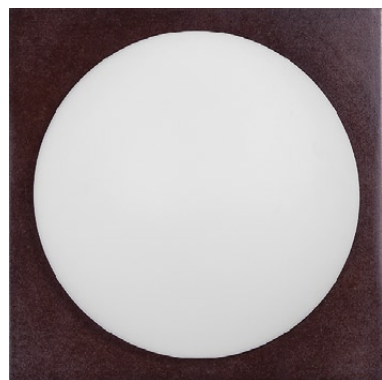
3935 LEA square wenge ↓ 30 cm ↔ 30 cm 1 x E27 max 60W IP 44