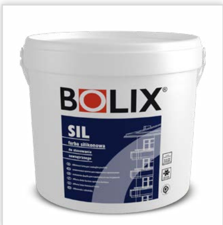
BOLIX SIL. Silikonowa farba elewacyjna. Cechy: wysoka odporność na: porastanie przez glony i grzyby – ochrona mikrobiologiczna formuła BOLIX Complex; objęta Rekomendacją ITB w zakresie renowacji i ochrony mikrobiologicznej, oddziaływanie czynników atmosferycznych, promieniowanie UV – zawiera „absorbery UV”. Stosując farbę BOLIX SIL w ciemnej kolorystyce na bazie 00 STRONG otrzymujemy: wysoką odporność na zarysowania powłoki malarskiej i brak „efektu zamśzu”.