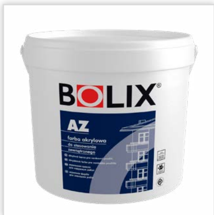
BOLIX AZ. Akrylowa farba elewacyjna. Cechy: wysoka stabilność kolorów, podwyższona odporność na: o porastanie przez glony i grzyby, na oddziaływanie czynników atmosferycznych, promieniowanie UV – zawiera „absorbery UV”, wysolenia – posiada system blokowania jonów wapienia tzw. „bloker wysoleń”, szeroka gama kolorystyczna, stanowi element systemów ociepleń BOLIX na płytach styropianowych EPS.