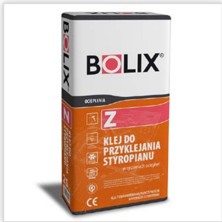
BOLIX Z. Zaprawa klejąca do przyklejania płyt EPS do typowych podłoży mineralnych (takich jak: beton, ściany murowane, tynki cementowe i cementowo-wapienne, itp.). Cechy: dobra przyczepność do podłoża mineralnego i styropianu, dostosowana do wykonywania ociepleń budynków pasywnych i energooszczędnych o grubości płyt EPS do 50 cm, do płyt EPS, w tym grafitowych i XPS. Orientacyjne zużycie: \geq 4,0 kg/m 2 .