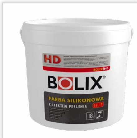
BOLIX SIL-P. Nanosilikonowa farba elewacyjna z efektem „perlenia”. Cechy: wysoka odporność na: porastanie przez glony i grzyby o oddziaływanie czynników atmosferycznych oraz na promieniowanie UV – zawiera „absorbery UV”, wysoka hydrofobowość umożliwiająca tzw. samoczyszczący efekt „perlenia”.