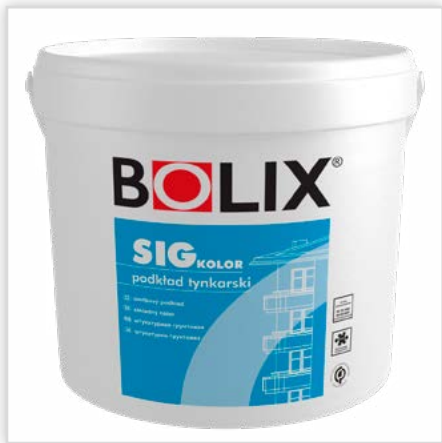
BOLIX SIG KOLOR. Podkład tynkarski pod cienkowarstwowe tynki silikonowe i silikatowo-silikonowe. Cechy: ułatwia nakładanie tynków – zawiera mączkę kwarcową, wzmacnia podłoże, redukuje pylistość i ujednolica chłonność podłoża, zabezpiecza zagruntowaną powierzchnię przed szkodliwym działaniem wilgoci, ogranicza efekt przebijania koloru podłoża przez strukturę tynku, stanowi element systemów ociepleń BOLIX na płytach EPS oraz płytach z wełny mineralnej.