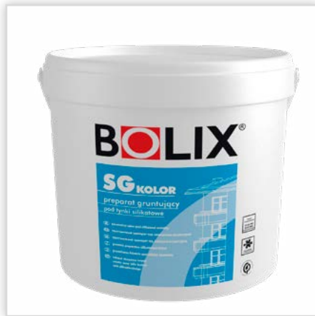
BOLIX SG KOLOR. Preparat gruntujący pod farby silikatowe. Cechy: wzmacnia podłoże, redukuje pylistość i ujednolica chłonność podłoża, zabezpiecza zagruntowaną powierzchnię przed szkodliwym działaniem wilgoci, zapobiega przenoszeniu zanieczyszczeń z warstw podkładowych i minimalizuje możliwość wystąpienia plam, stanowi element systemów ociepleń BOLIX na płytach styropianowych EPS oraz płytach z wełny mineralnej.