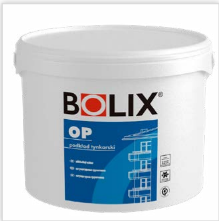
BOLIX OP. Podkład tynkarski pod cienkowarstwowe tynki mineralne, akrylowe i dekoracyjne. Cechy: ułatwia nakładanie tynków – zawiera mączkę kwarcową, wzmacnia podłoże, zapobiega przenoszeniu zanieczyszczeń z warstw podkładowych do tynku i minimalizuje możliwość wystąpienia plam, ogranicza efekt przebijania koloru podłoża przez strukturę tynku, stanowi element systemów ociepleń BOLIX na płytach EPS i płytach z wełny mineralnej.