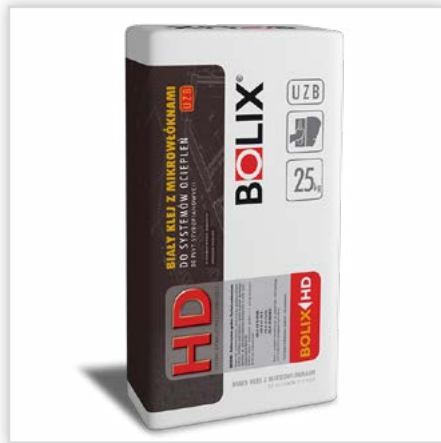
BOLIX UZB. Zaprawa klejąca do zatapiaenia siatki i przyklejania płyt EPS do typowych podłoży mineralnych, a także do mocowania drugiej warstwy ocieplenia na ścianach już ocieplonych. Cechy: zbrojona mikrowłóknami – podwyższona odporność na powstawanie spękań i zarysowań, bardzo wysoka przyczepność do podłoża mineralnego i styropianu, możliwość prowadzenie prac przy temperaturze otoczenia i podłoża \geq +30^{\circ}\text{C} . Orientacyjne zużycie: \geq 4,0 kg/m 2 .