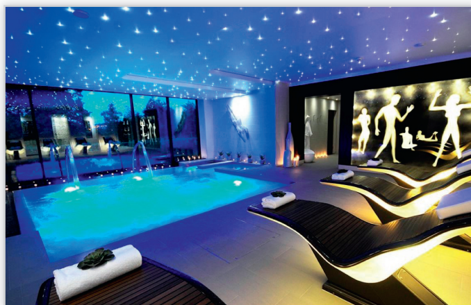
AQUA TECH – basen z wbudowanymi elementami SPA oraz atrakcjami wodnymi – przykład aranżacji basenu z plażą.