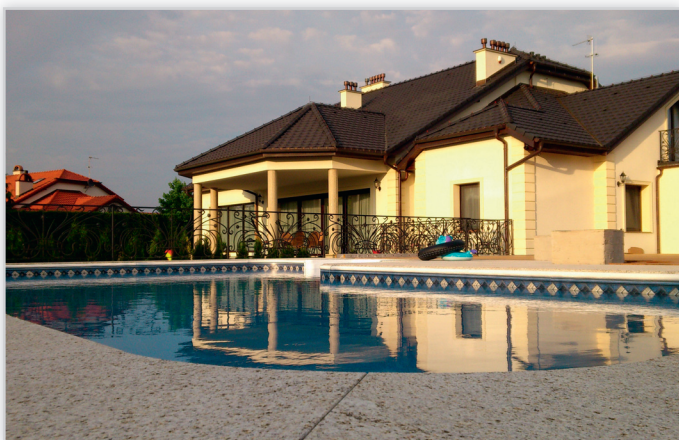
AQUA TECH – basen o zmiennej geometrii z wbudowanymi atrakcjami – przykład aranżacji basenu z plażą.