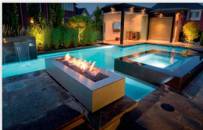
AQUA TECH – basen z wbudowanym SPA oraz zabudowanymi atrakcjami wodnymi – przykład aranżacji basenu z plażą.