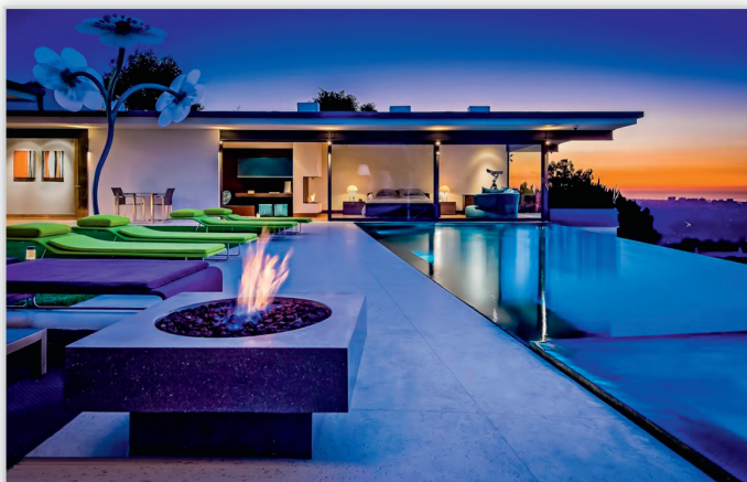
AQUA TECH – basen z krawędzią przelewową wykorzystującą różnicę poziomów terenu – przykład aranżacji basenu z plażą.