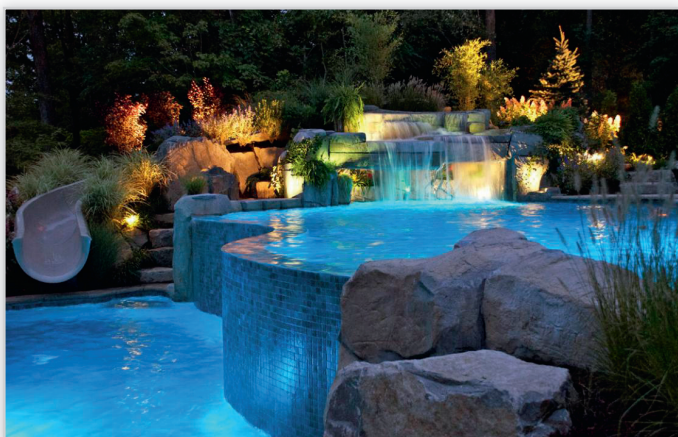
AQUA TECH – baseny z krawędzią przelewową wykorzystującą różnicę poziomów terenu, układ kaskadowy – przykład aranżacji.