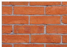
Sencis ręcznie formowana