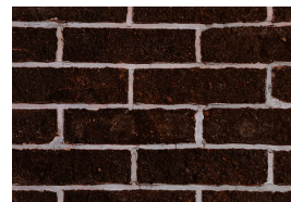
Sencis ręcznie formowana