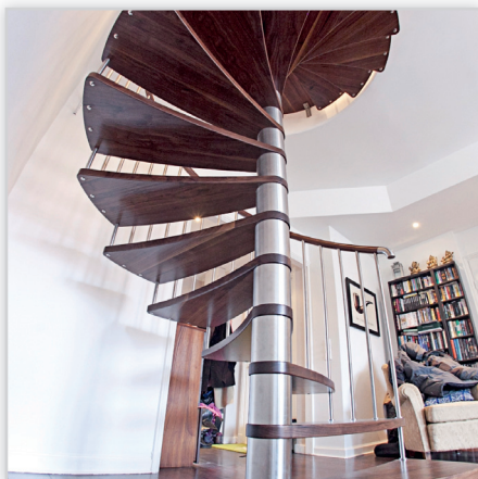
Schody okrągłe DX – stopnie dębowe bejcowane, balustrada rurki pionowe Ø 22, pochwyt drewniany Ø 50. Konstrukcja i wypełnienie balustrady – stal nierdzewna.