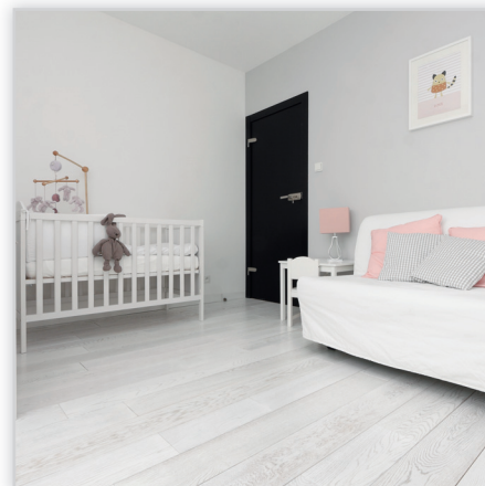
PODŁOGA WARSTWOWA – dąb naturalny, szcztokowany, bejcowany na kolor biały, lakier półmat. Odpowiednia do montażu na ogrzewaniu podłogowym.