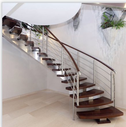
Schody gięte PRESTIGE – konstrukcja belka gięta nierdzewna, szlifowana, stopnie – dąb bejcowany, lakier półmat., balustrada nierdzewna 4 pręty, pochwyt drewniany Ø 50.