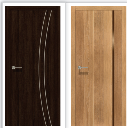
Drzwi wewnętrzne ALFA 01, GAMMA 02 – wykończenie powierzchni – fornir naturalny, możliwość wybarwienia wg wzornika TEK0, usłojenie pionowe, szyba hartowana grafit, zamek magnetyczny, zawias chowany, klamka i dekor INOX.