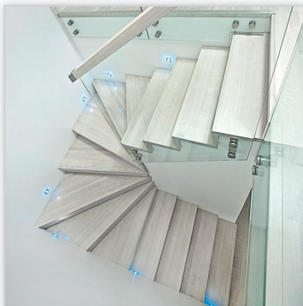
Schody pełne – schody betonowe obłożone drewnem dębowym, bielonym i lakierowanym. Balustrada szklana Flat, pochwyt drewniany o przekroju prostokątnym.