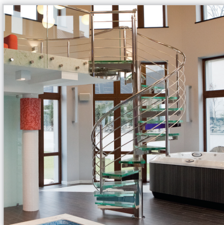
Schody okrągłe DX – stopnie szklane, konstrukcja ze stali nierdzewnej polerowanej, balustrada nierdzewna – 5 prętów, pochwyt okrągły Ø 50 ze stali nierdzewnej.