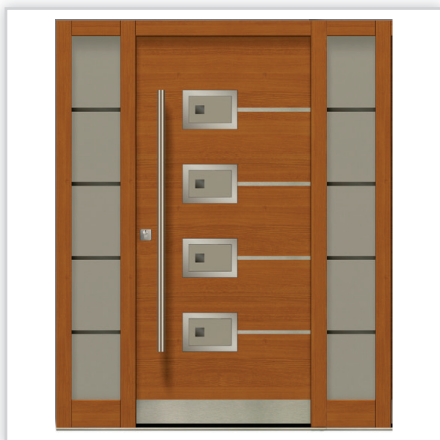
Drzwi zewnętrzne EPSILON 02 – wykończenie powierzchni – obiół dębowy bejcowany, usłojenie poziome, elementy wykończenia + pochwyt INOX, szyby piaskowane, naświetla boczne.