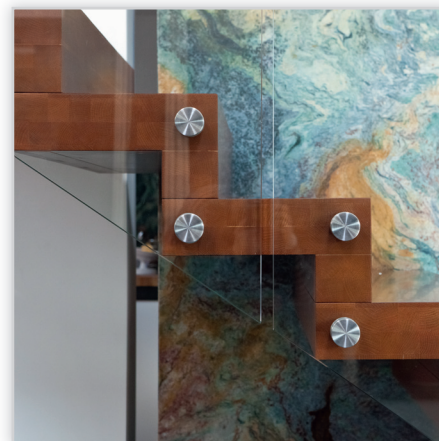
Schody dywanowe – dąb bejcowany, lakier półmat., balustrada szklana Flat z pochwyt drewnianym o przekroju prostokątnym.