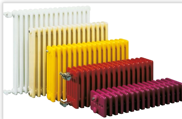
Vogel & Noot, Grzejnik kolumnowy LaserLine Standard. Dekoracyjne grzejniki kolumnowe z precyzyjnej rury stalowej z kompletnym niewidocznym spawaniem laserowym. Rury i głowice są spłaszczone na stronach zewnętrznych dla podwyższenia mocy cieplnej. Podłączenia 4 x GW 1/2" (na przedniej stronie), pasuje również do zestawu króćców przyłączy starych grzejników żeliwnych. Dostępne w szerokiej paletce kolorów RAL. Występuje również w formie zaworowej z podłączeniem środkowym. Wymiary (wys./szer./głęb.) [mm]: (155-3000)/(200-2500)/(63-215).