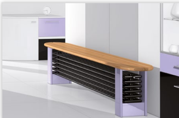
Vogel & Noot, Grzejnik kolumnowy LaserLine Bank. Dekoracyjny grzejnik kolumnowy z precyzyjnej rury stalowej z kompletnym niewidocznym spawaniem laserowym. LaserLine Bank to połączenie nowoczesnych technologii grzewczych, innowacyjnego designu i funkcjonalności (praktyczna ławeczka lub przydatna półka). Występuje w różnych kolorach i wymiarach. Wymiary (wys./szer./głęb.) [mm]: (422-572)/(1850-3150)/370.