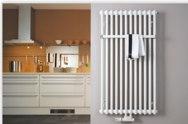
Vogel & Noot, Grzejnik kolumnowy LaserLine Twin. Klasyczny styl oraz prosty design. Poprzez dwukolumnową budowę grzejnik idealnie odnajduje się w mniejszych pomieszczeniach. Model Twin dostarczany jest łącznie z ruchomym w pionie wieszakiem w kolorze grzejnika (z chromowanym uchwytem) oraz zestawem mocującym. Grzejnik LaserLine Twin występuje w różnych kolorach i wymiarach. Wymiary (wys./szer./głęb.) [mm]: (1000-1800)/(500, 600)/63.