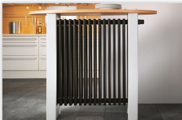
Vogel & Noot, Grzejnik kolumnowy LaserLine Theke. Dekoracyjny grzejnik kolumnowy w formie bufetu, z precyzyjnej rury stalowej z kompletnym niewidocznym spawaniem laserowym. LaserLine Theke udowadnia, że możliwe jest połączenie nowoczesnego designu, funkcjonalności oraz wysokiej mocy grzewczej. Występuje w różnych kolorach i rozmiarach. Wymiary (wys./szer./głęb.) [mm]: (940, 1090)/(720, 920, 1120)/(224, 262).