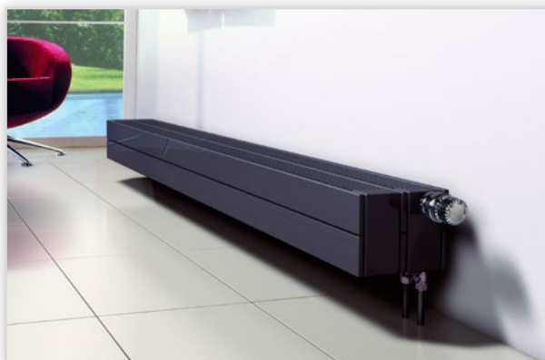
Vogel & Noot, Grzejnik konwektorowy Vonaris. Grzejnik konwektorowy, który przekonuje do siebie poprzez szybkości i łatwy montaż oraz nowatorski wygląd. Wyposażenie fabryczne: przyspawany zespół zaworowy, odpowiedni dla instalacji dwu- lub jednorurowych, wkładka zaworowa, osłony boczne (wersja pozioma – pokrywa górną). Wersje: standardowa, wysokociśnieniowa, VONARIS-M z podłączeniem środkowym. Dostępny w różnych kolorach. Dł./wys. wersji poziomej w zależności od typu: 500-1400 mm (krok co 100 mm) i 1400-4000 mm (krok co 200 mm)/142, 214, 286, 358, 430, 502, 574, 646 i 790 mm. Szer./wys. wersji pionowej: 214-862 mm (krok co 72 mm)/1600, 1800 i 2000 mm.