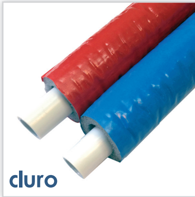
cluro, Rura PE-Xb/Al/PE-Xb w izolacji. Zastosowanie: w budownictwie. Zalety: T_{max} = 95^{\circ}C , odporna na przegrzewy, izolacja w kolorze niebieskim i czerwonym. Pozostała oferta: rury wielowarstwowe, złączki zaciskowe.