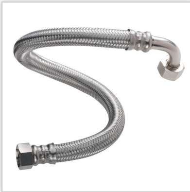
TUCAI, Wężę wodne w oplocie ze stali nierdzewnej. Zastosowanie: w budownictwie i przemyśle. Zalety: wewnętrzny przewód z EPDM (czysta guma), opłotek ze stali nierdzewnej wysokiej jakości, 10 lat gwarancji, produkt europejski. Pozostała oferta: wężę – gazowe, karbowane w zwojach ze stali nierdzewnej, przyszlucowe.