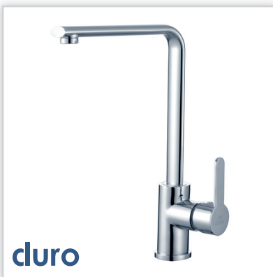
cluro, Baterie. Zastosowanie: w budownictwie. Zalety: 100% baterii sprawdzanych na szczelność, korpusy wykonane z mosiądzu odpowiadającego normom europejskim i wymaganiom Państwowego Zakładu Higieny, głowice o wysokim współczynniku przepływu, 5 lat gwarancji, serwis w domu klienta. Pozostała oferta: akcesoria do baterii.