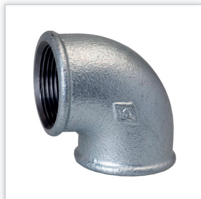
SOBIME, Łączniki żeliwne ocynkowane. Zalety: żeliwo ciągliwe zgodne z normą PN-EN 10242, gwinty zgodne z normą ISO PN 7/1, wysoka precyzja wykonania, wysokiej jakości powłoka galwaniczna, 2-letnia gwarancja i ubezpieczenie. Pozostała oferta: łączniki żeliwne czarne, zawory żeliwne grzybkowe, głowice do zaworów.