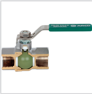
ARCO, Zawory kulowe antykamienne. Zastosowanie: w budownictwie i przemyśle. Zalety: produkty europejskie, korpusy odkuwane, kule antykamienne gwarantujące wieloletnią bezawaryjną pracę. Pozostała oferta: zawory: kątowe, grzejnikowe, gazowe, stopowe, redukcyjne.