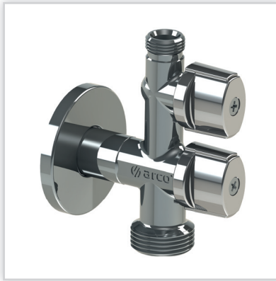
ARCO, Zawory kulowe antykamienne. Zastosowanie: w budownictwie. Zalety: produkty europejskie, korpusy odkuwane, kule antykamienne gwarantujące wieloletnią bezawaryjną pracę. Pozostała oferta: zawory: kulowe, grzejnikowe, gazowe, stopowe, redukcyjne.