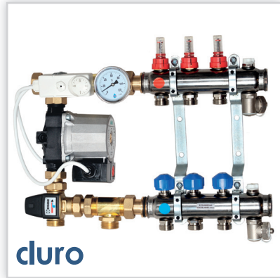
cluro, Rozdzielacze ze stali nierdzewnej i układy pompy. Zastosowanie: w budownictwie. Zalety: każdy testowany na szczelność ciśnieniem 8 bar, osprzęt znanych producentów europejskich: Tacsona, ESBE, Wilo, Jürgen Schlösser. Pozostała oferta: szafki do rozdzielaczy.