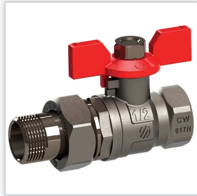
ARCO, Zawory kulowe SENA VA 30 z dławicą. Zastosowanie: w budownictwie i przemyśle. Zalety: produkty europejskie, korpusy odkuwane, T_{max} = 120^{\circ}C , PN = 30 bar, dźwignie pokryte powłoką antykorozyjną. Pozostała oferta: zawory: kątowe, grzejnikowe, gazowe, stopowe, redukcyjne.