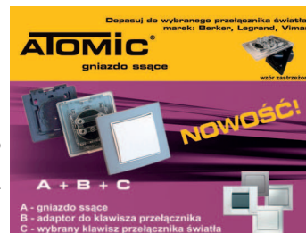
System gniazda ATOMIC