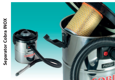
Separator Cobra INOX