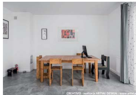
CREATIVO - realizacja ARTIAL DESIGN - www.artial.pl

waż wyróżnia się wysoką odpornością na zarysowania, promieniowanie UV oraz nie absorbuje cieczy. ●