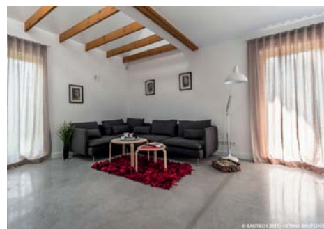
© BAUTECH 2017 - ULTIMA BAUFLOOR