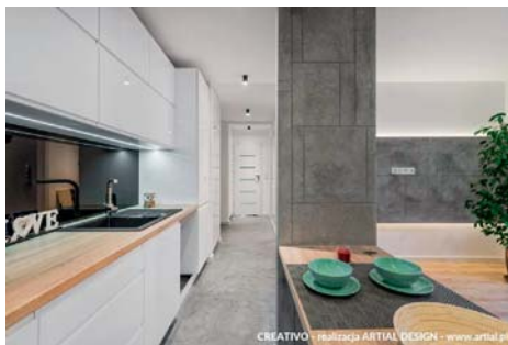
CREATIVO - realizacja ARTIAL DESIGN - www.artial.pl