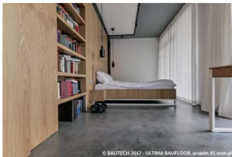
© BAUTECH 2017 - ULTIMA BAUFLOOR, projekt: B1.waw.pl