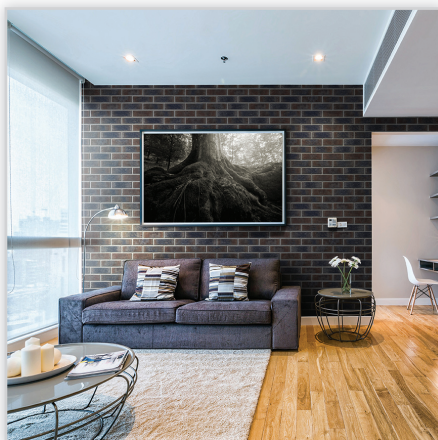
Płytki klinkierowa – HF27 Blues shadow

Zastosowanie: elewacje wszelkiego rodzaju budynków, wnętrza, ogrodzenia i mała architektura.