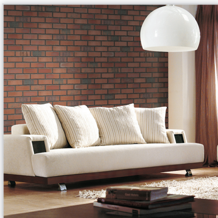
Płytki klinkierowa – HF50 Old factory

Zastosowanie: elewacje wszelkiego rodzaju budynków, wnętrza, ogrodzenia i mała architektura.