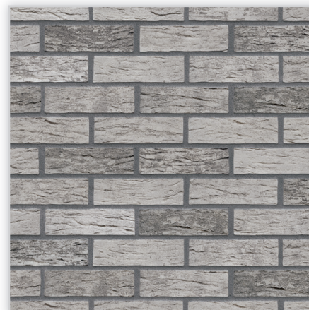
Klinkier Przysucha, Płytki klinkierowa – HF45 Aztec ghost

Zastosowanie: elewacje wszelkiego rodzaju budynków, wnętrza, ogrodzenia i mała architektura.