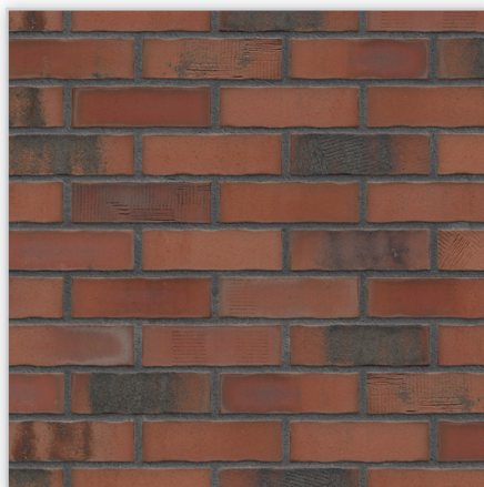
Płytki klinkierowa – HF50 Old factory

Zastosowanie: elewacje wszelkiego rodzaju budynków, wnętrza, ogrodzenia i mała architektura.