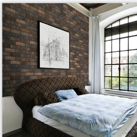
Płytki klinkierowa – HF20 Monastic cellar

Zastosowanie: elewacje wszelkiego rodzaju budynków, wnętrza, ogrodzenia i mała architektura.