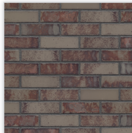
Płytki klinkierowa – HF48 Astro house

Zastosowanie: elewacje wszelkiego rodzaju budynków, wnętrza, ogrodzenia i mała architektura.