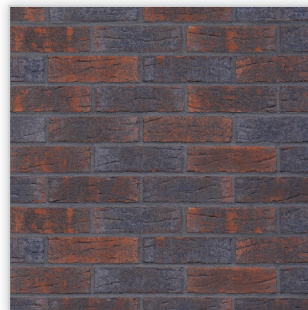
Płytki klinkierowa – HF28 Industrial revolution

Zastosowanie: elewacje wszelkiego rodzaju budynków, wnętrza, ogrodzenia i mała architektura.