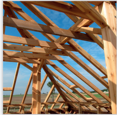
Tartak Witkowsky, Budynek mieszkalny jednorodzinny . Konstrukcja więźby: tradycyjna z obróbką CNC. Lokalizacja: Grębąnin k/Kępna.