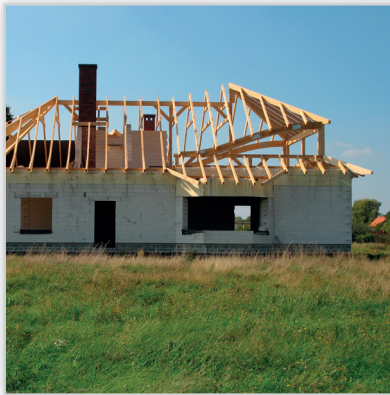
Tartak Witkowsky, Budynek mieszkalny jednorodzinny . Konstrukcja więźby: tradycyjna z obróbką CNC. Lokalizacja: pod Wrocławiem.