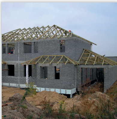
Tartak Witkowsky, Osiedle Zielone Wzgórza . Konstrukcja dachu: łączona na płytki kolczaste. Lokalizacja: Łódź.