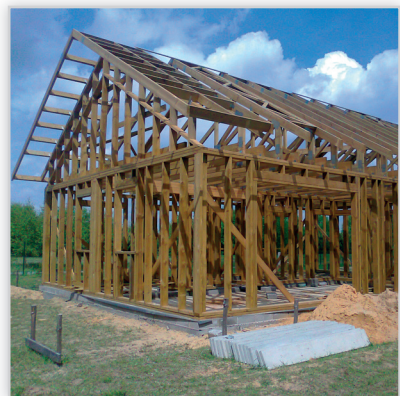
Tartak Witkowsky, Budynek mieszkalny jednorodzinny . Konstrukcja ścian: szkieletowa z dachem więzaryowym łączonym na płytki kolczaste. Lokalizacja: okolice Częstochowy.