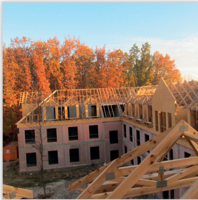
Tartak Witkowsky, Dom spokojnej jesieni . Konstrukcja dachu: łączona na płytki kolczaste. Lokalizacja: Sulejówek.