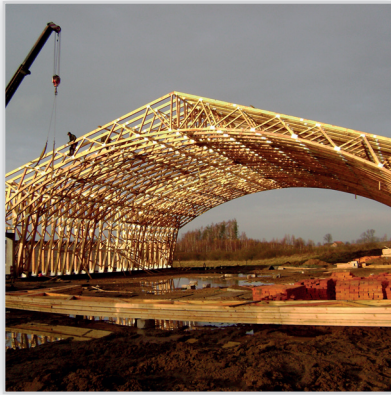
Tartak Witkowsky, Ujeżdżalnia dla koni . Konstrukcja: ramowa łączona na płytki kolczaste. Wymiary rzutu: 30/60 m. Lokalizacja: Kierwiny k/Lidzbarka Warmińskiego.