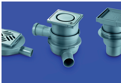
Wpusty łazienkowe KesselDesign