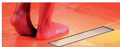
Odpił przysicowy Linearis Compact

MATERIAŁY DO INSTALACJI / ODPIŁY, WPUSTY