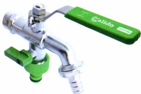
Fot. 1. Zawór czerpalny OGRÓD BIS.

Ponieważ zawór jest narażony na czynniki atmosferyczne, jego dźwignia zamykająca oraz nakrętka wykonane są ze stali nierdzewnej. Wylewka zaworu wyposażona jest w kierownicę strumienia, co eliminuje rozbryzgi podczas napełniania naczynia do podlewania.