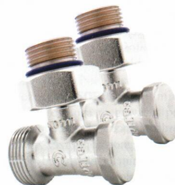
Fot. 3. Przyłącze dolne kątowe bez mostka.

Nowo zaprojektowane przyłącza grzejnikowe charakteryzują się małymi oporami przepływu, co jak wiadomo przekłada się na niższe zuży-