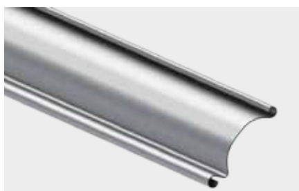
PROFIL ALUMINIOWY JEDNOŚCIENNY o wysokości krycia 91 mm