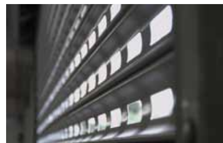
KRATA ROLOWANA R2 AM