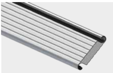
PROFIL ALUMINIOWY OCIEPLONY o wysokości krycia 100 mm

Bramy przemysłowe mają bardzo różne przeznaczenia. Produkujemy je dokładnie według wskazanych wymiarów, stosując rozwiązania dopasowujące urządzenia do różnych zadań i warunków zabudowy. Są to m. in. profile z okienkami oraz profile wentylacyjne, a w bramach zimnych profile perforowane. Ciekawą propozycją jest tzw. „brama z tatuażem”, czyli z indywidualnie zaprojektowaną perforacją pancerza, np. nawiązującą wzorem do prowadzonej w danym obiekcie działalności.